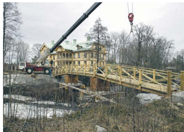
Herrgården i Långvind har fått en 22,5 meter lång bro i gammal stil.