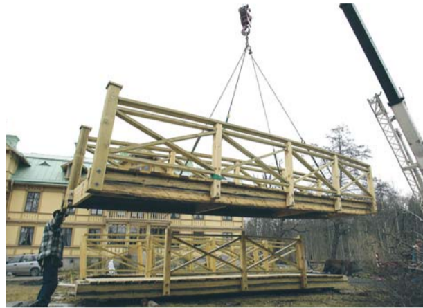
Mittendelen är på gång.